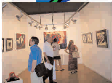
De flesta besökarna under vernissagen var mallorquiner och spanjorer, men konstinresserade svenska Sveor sågs också bland publiken.