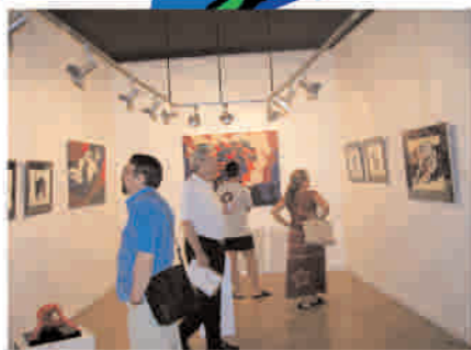
De flesta besökarna under vernissagen var mallorquiner och spanjorer, men konstinresserade svenska Sveor sågs också bland publiken.