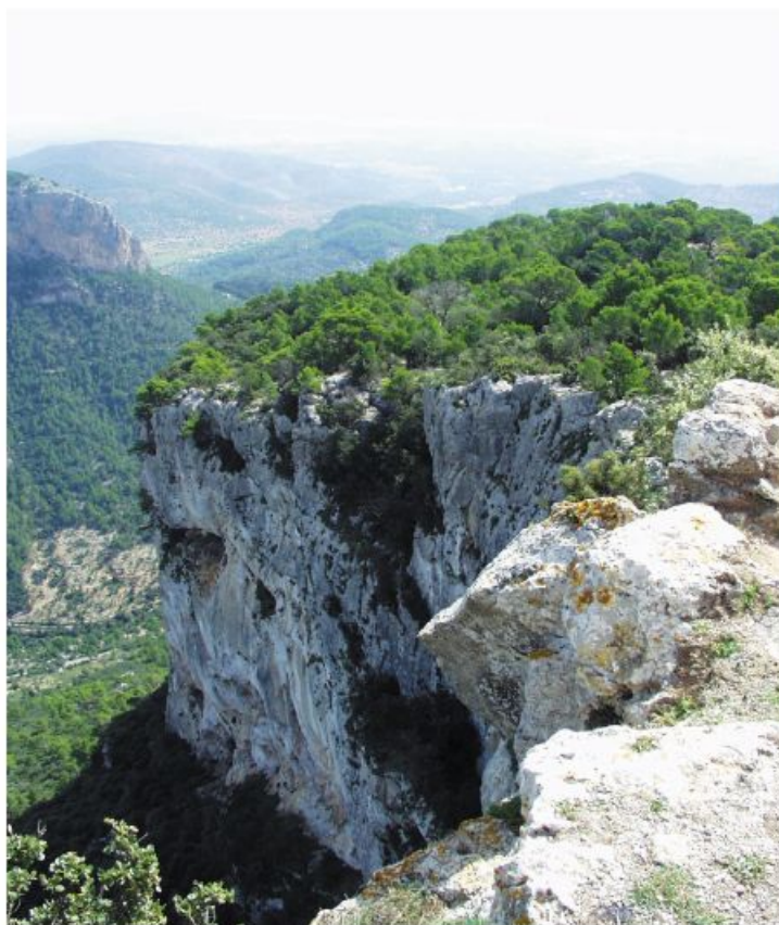
Kapellet på toppen blev byggt för att ära två officerare som blev brutalt avrättade på platsen nedanför berget.