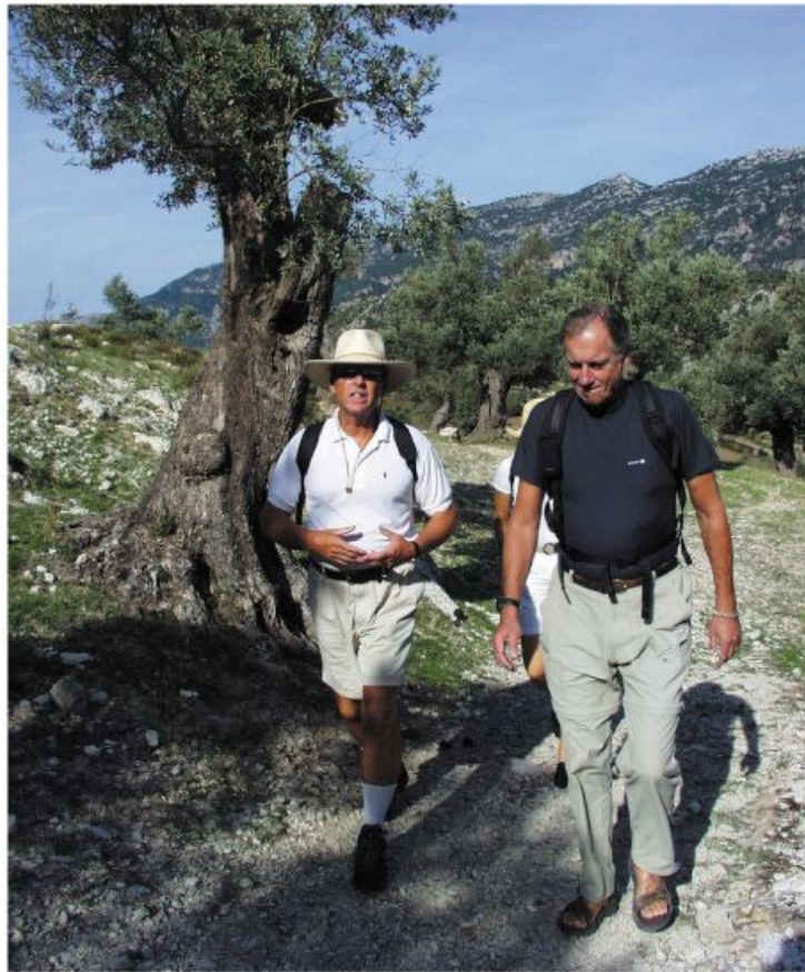
Vandringen gick i lagom takt, på enkla stigar mellan olivlundar, fikonträd, johannesbrödträd.

talar om att man måste vara sparsam med vattnet och inte tvätta sina kläder. Har du tur är det enda dubbelrummet ledigt, men de flesta rum är gamla sovsalar till soldaterna med plats för 6, 8 eller 10 personer. En säng över natten kostar sex euro. Men man bygger just nu en ny avdelning, som kommer att ha lite mer bekväma omgivningar.