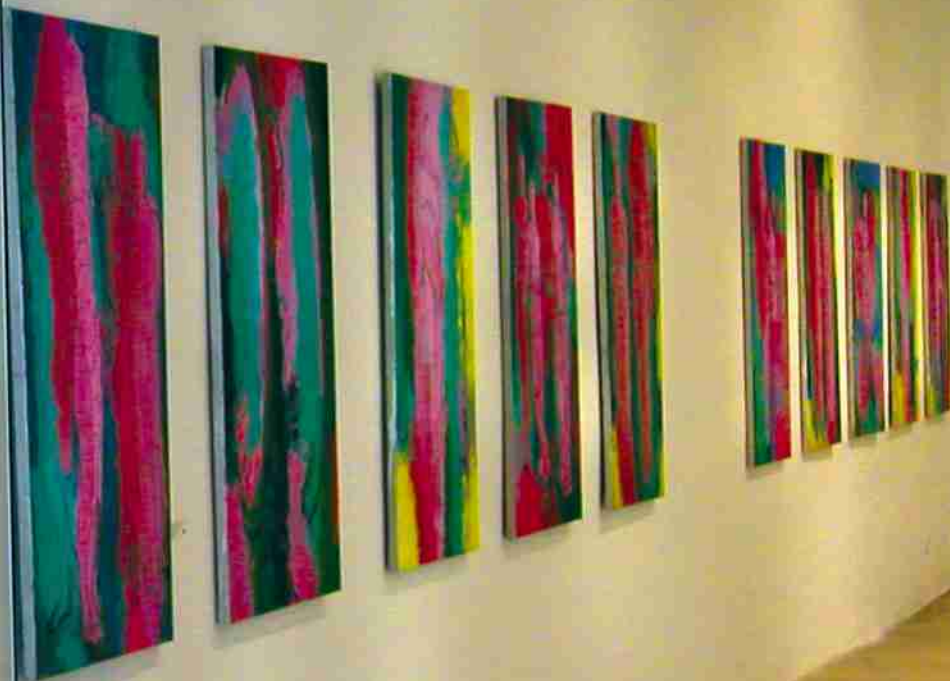
Centro Cultural Andratx ligger på vägen mot Es Capdella.