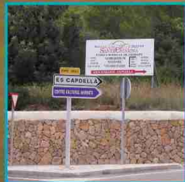
Centro Cultural Andratx ligger på vägen mot Es Capella.