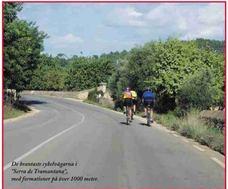
De brantaste cykelvägarna i "Serra de Tramuntana", med formationer på över 1000 meter.

För sportdykare, finns det knappast ett mer passande område än det som sträcker sig runt de Baleariska öarna. Hit kommer entusiasterna, de som älskar att utforska den spännande naturen under vattenytan. VS